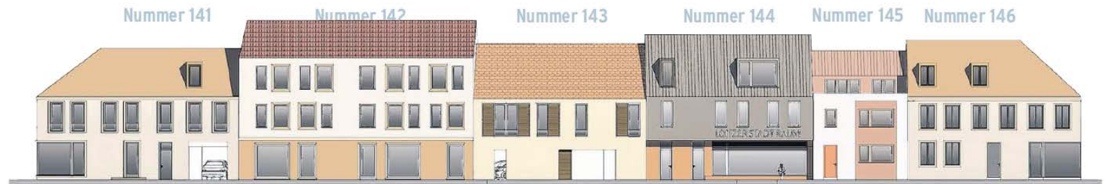
Die neue Straßenfront der Ostseite der Breiten Straße von Loitz? Der Siegerentwurf legt sich auf eine durchgehende Bebauung fest.